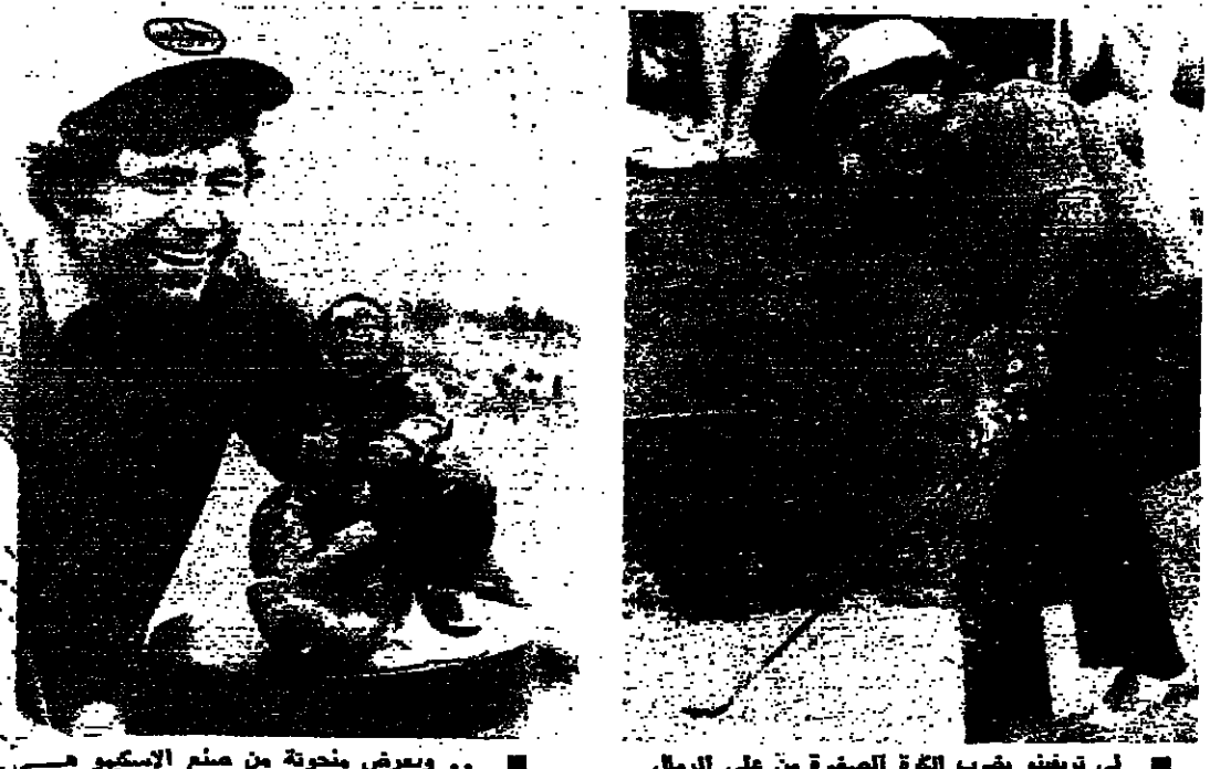
لي ترفين ويضرب الكرة الصيفية من على الرمال في اليوم الآخر لبطولة كندا باللغوف في ملعب نادي فليمنج في لونغويل. وقد استأجر فريقه الأضواء من قبله. وتراها في لونغويل. وقد سجل ترفين ١٨. وقام بجائزها ٤٤ ألف دولار